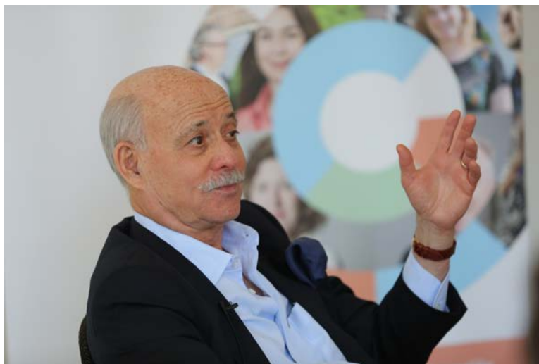
Jeremy Rifkin tijdens de GEA persconferentie

Rifkins ideeën over technische en maatschappelijke innovatie zijn tijdens en na zijn bezoek binnen het Gelders Energieakkoord uitvoerig besproken. Voor de beleidskeuzes heeft deze toekomstagenda gebruik gemaakt van regionale ontwikkelprogramma’s van Rotterdam – Den Haag, Luxemburg en Hauts de France (bij alle drie is Rifkin betrokken).